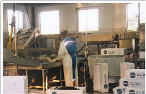
מסוע המקבל את דגי הסלמון מהכלובים ומוביל אל ההשרייה לקטילת הבקטריות והאריזה