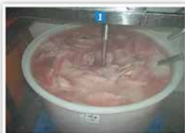
ערבוב הדגים עם המרינדה