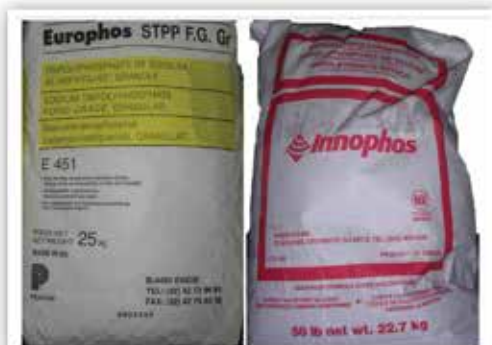
סוגים שונים של סודיום טרי פוליפוספאט

סוגי התוספים, הוא החל במים, עמילנים, פוספאטים, תבלינים, ועוד. ניתן למנות את התוספים הבאים המוכרים לנו היום: מאלטודקסטרין, עמילן טופיוקה, קורנפלור, סוכר, מלח, סודיום סיטארט, סודיום טרי פולי פוספאט, טרי פולי פוספאט, פלפל שחור/לבן, עלי תבלין מיובשים.