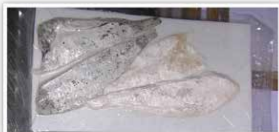
יציאה ממסוע השטיפה, סידור על המגשים והכנסה להקפאה