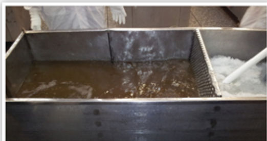
מים קרים עם קרח לשמירת הקור, למטרת גלייזינג