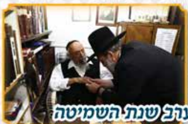
ברכתם של גדולי ישראל ערב שנת השמיטה