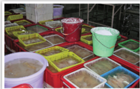
שיטת השריה בדליי פלסטיק עם פוספאט של דגי סול