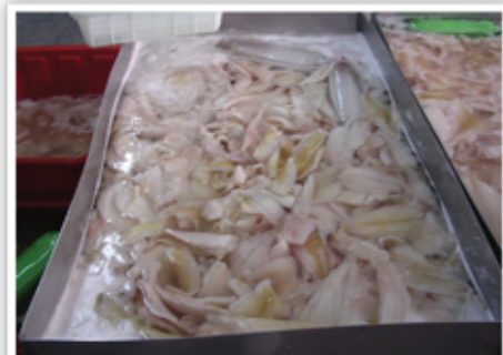
שיטה נוספת להשריה במיכלי מתכת