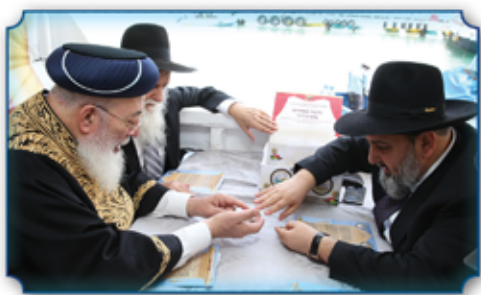
ההכנות לקראת חילול המטבעות

חובת הביעור של נטע רבעי הוא רק על הנטיעות ששייכות לשנים א-ג, אולם אותם שחנטו בשנה הרביעית יתבערו בשביעית, ואותם שחנטו בשנה השביעית מתבערים בשנה הרביעית הבאה, וכן העיקר הלכה למעשה (כמו שביארנו בספרי עץ השדה על הל' ערלה ונט"ד בפ"ג סעי' כז).