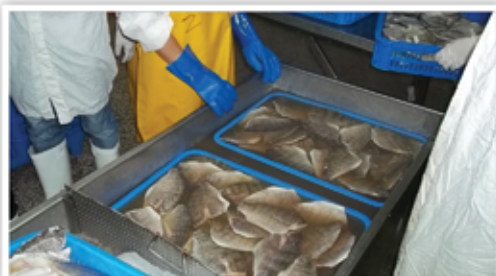
גלייזינג לפילה הדגים

שיטת ההחדרה, קיימת שיטות מתקדמות יותר וזה באמצעות הזרקות ישירות לתוך בשר הדג באמצעות מכונה עם מחטים [בדומה למכונה המזריקה לבשר בקר], כאשר לאחר ניקוי הדג מהעור והעצמות, הדג עובר שטיפה מכל צדדיו, ונכנס ידנית למסוע לתוך מכונה כשמעל החתיכה יורד משטח שבקצהו מחטים רבים שתפקידם הוא לנקוב בבשר הדג וברו בכך באותו זמן מחדיר לתוך הבשר את התוספים. למכונה מחובר צינור שיונק ממכל צדדי את התוספים כשהם מעורבבים.