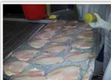
ביזוק מתוך בקבוק לפני הכניסה למסוע