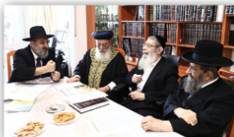
ישיבת הערמת של רבני אוצר ב"ד