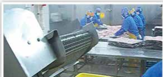
הדגים לאחר הציפוי נארוים בוואקום ומשווקים באופן זה