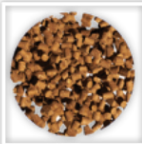
כופתיות אוכל לדגי הסלמון בכלובים

צבעי מאכל כהוספה לדגים, היא תופעה שאפשרית אולם בפועל אין שימוש בזה מטעמים מסחריים ומשום אי הצורך בשימוש בהם. השימוש היותר בולט היה בעבר בדגי סלמון שמקורם בכלובים וצבעם היה חיוור יותר, והמטרה הייתה כדי שהצבע יהיה