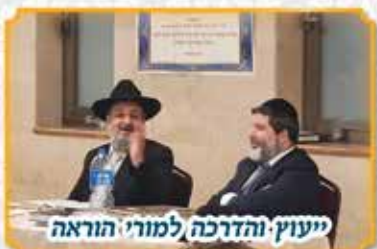
"יעוץ והדרכה למורי הוראה"