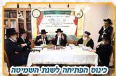
כינוס הפתיחה לשנת השמיטה