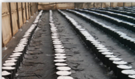
מצע מנותק בחממה לפני שתילה עם מצע פרליט

שתילים - במהלך שנת השמיטה יירכשו שתילים רק ממשלתות העומדות תחת פיקוח המכון בלבד. הובלת השתילים תהיה במיתקן אטום לחלוטין בתחתיתו ובצדדיו. יש להקפיד על ניתוק מוחלט החל מהציאה מהמשתלה עד הכניסה לחממה. ורק לאחר הכניסה לחממה על גבי מצע מנותק ייפתח המיתקן וישתלו השתילים.