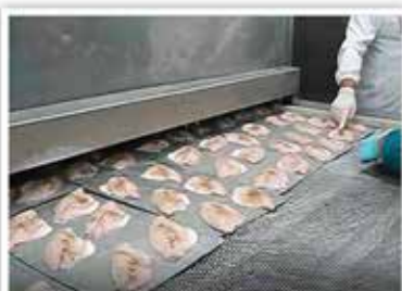
בתום הביזוק כניסה לשוק פריזר