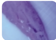
תולעי אניסאקיס בדג סלמון (ים)