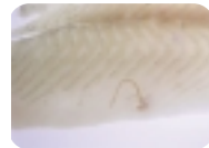
תולעת אניסאקיס בדג ילופין - סול