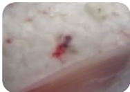
טפיל לתיאה בדג אמור

כשאתם קונים דגים טריים ומצוננים בחנויות שתחת פיקוח ואישור המכון למצוות התלויות בארץ, שבראשות הרה"ג שניאור ז. רווח שליט"א, אתם יכולים להיות רגועים ולדעת שהדגים נקיים מחשש תולעים וטפילים וכשרים לאכילה. ● פיקוח המכון הוא ייחודי במינו, והוא מתבצע על כל שרשרת הגידול, החל מבריכות הגידול הנמצאים בכל חלקי הארץ, דרך מרכזי השיווק לסיטונאים ועד לחנויות המוכרות לצרכן. ● המכון למצוות התלויות בארץ, הוא הגוף היחיד כיום בעולם, המפקח על ייצור דגי סול, פולוק, סלמון (ים), פלאונדר, קוד - במפעלים רבים בעולם בייצור מיוחד ובשיטה ייחודית שפיתח עם השנים (שיטה מיוחדת וספציפית המתאימה לכל דג בנפרד), בשיטה זו מנקים ומסירים את כל התולעים מבשר הדגים. התוצרת מגיעה לארץ ארוזה, כאשר חותם "נבדק" של המעבדה מתנוססת על השקית ומאשרת, כי אכן הדגים נקיים מכל חשש תולעים.