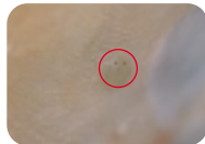
טפיל ארגולוס דג קרפיון