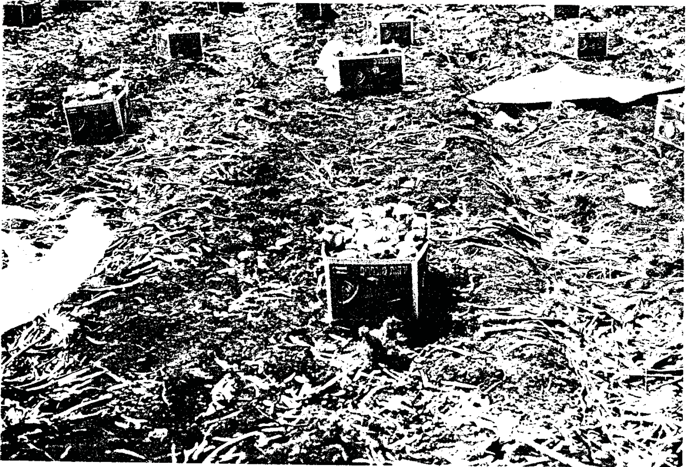
גמר מלאכה בבצל