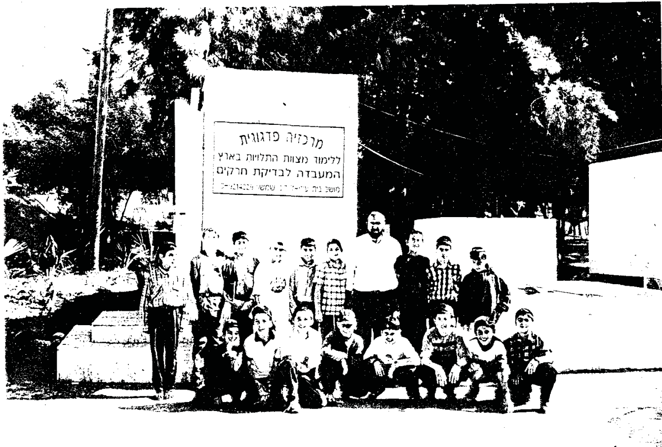
ביקור תלמידים במרכזיה פדגוגית