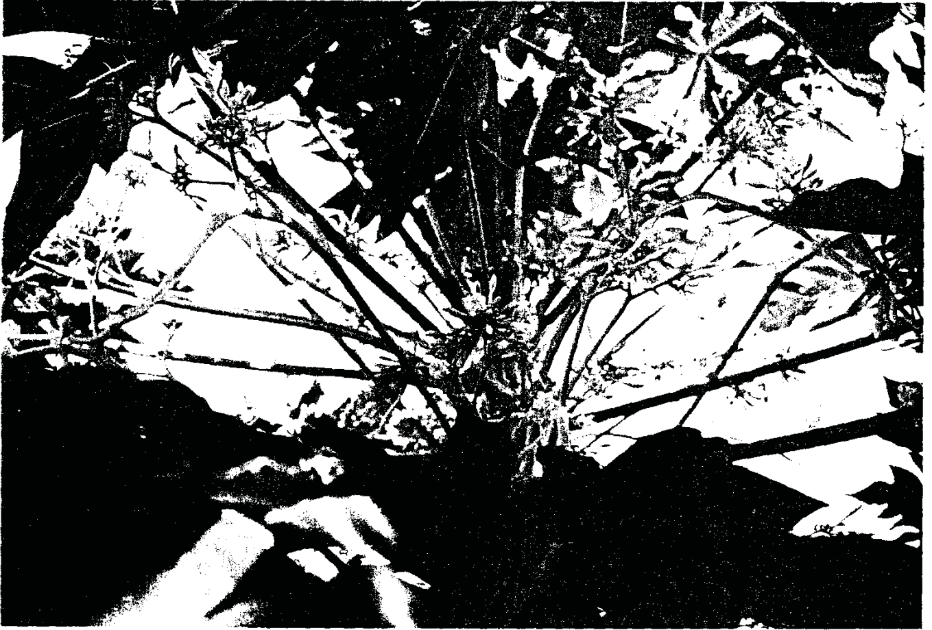
פאפיה - זכר