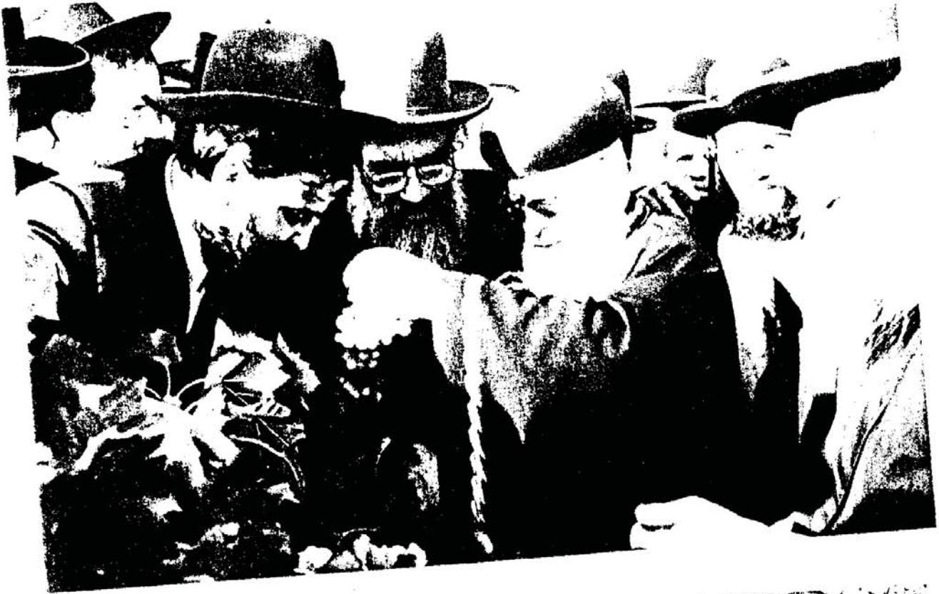
מתנות עניים בכרם