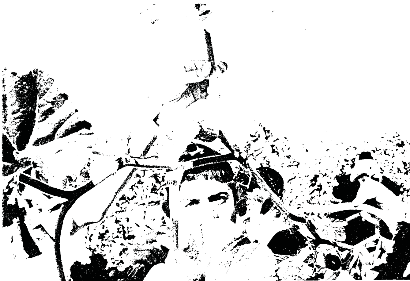
ביקור תלמידים בחוות מחקר