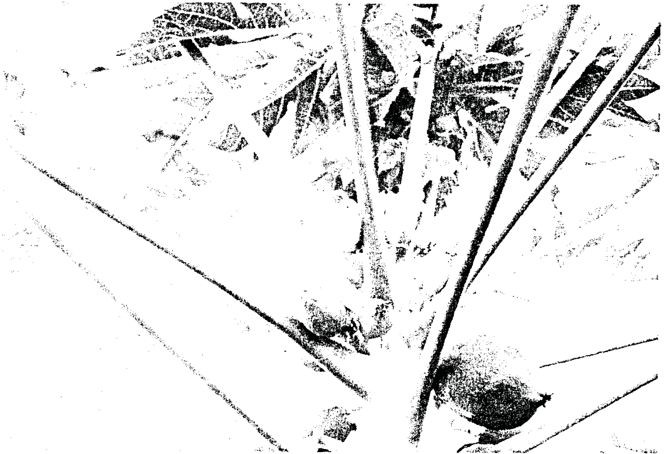
פאפיה - נקבה