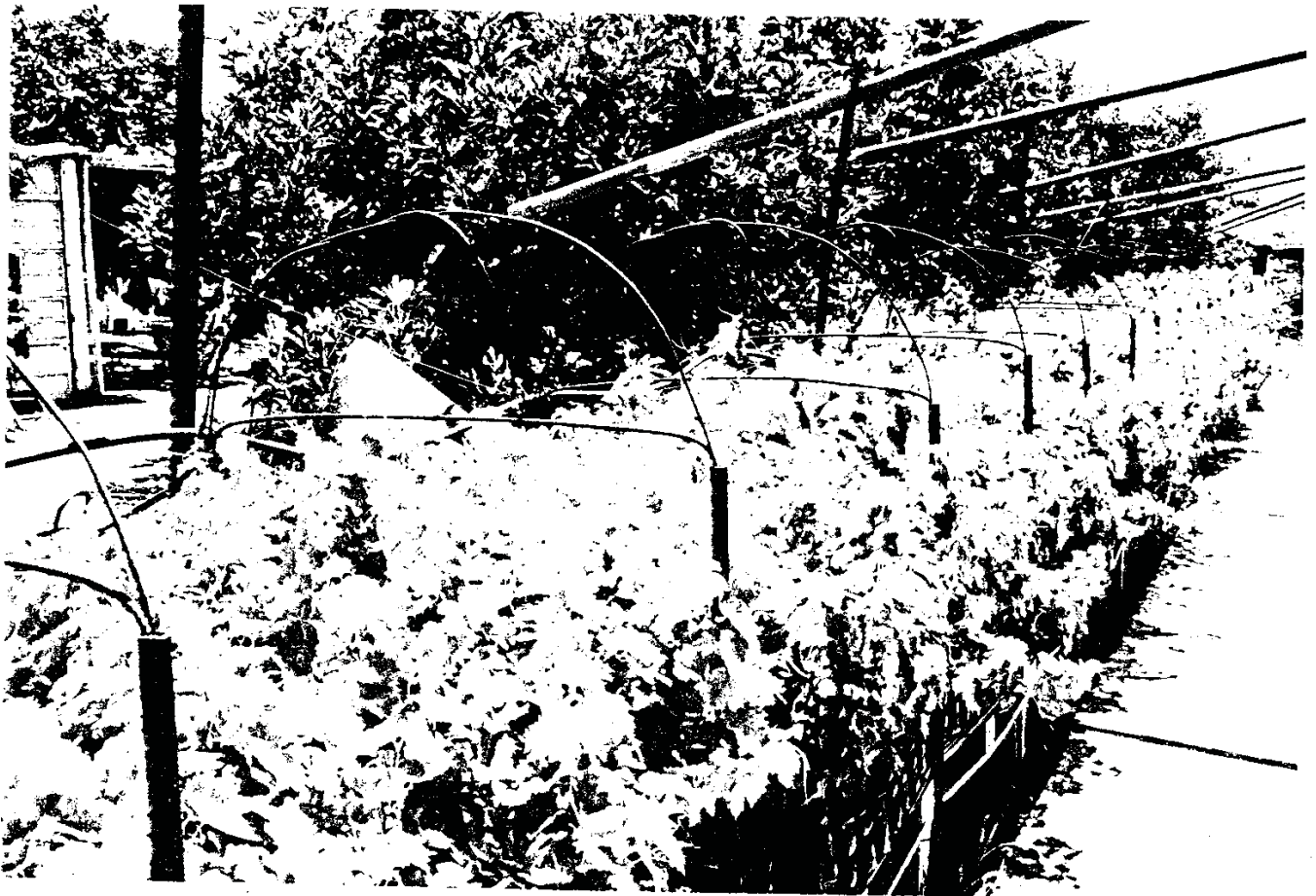
משתלה שאינה על פי ההלכה