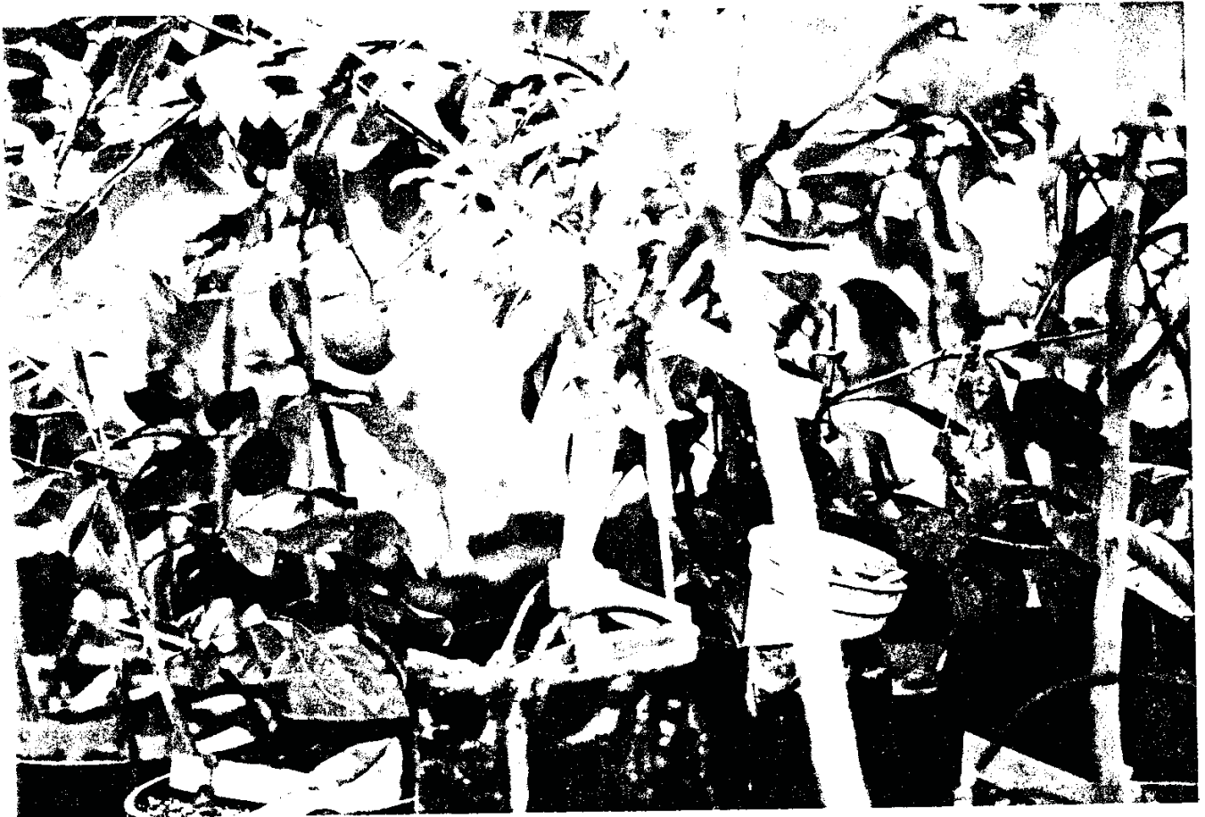
הרכבת ירק [עגבניה] על אילן [תפוז]