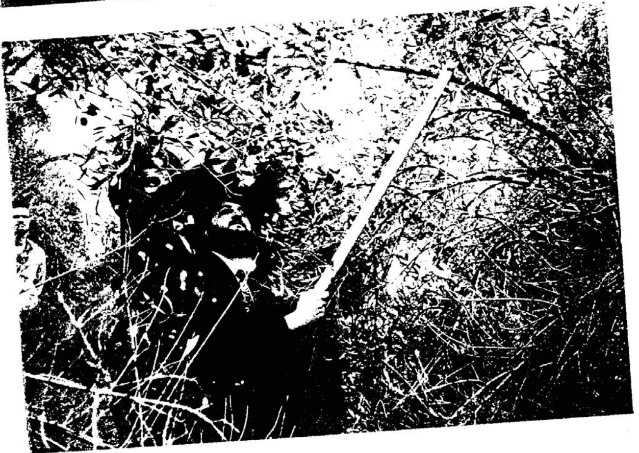
מתנות עניים בוייתים